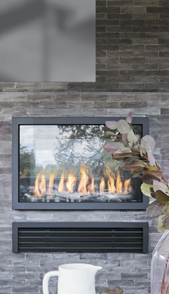
MONTIGO / EXEMPLAR / R324STION / PERLES DE FEU SAUGE